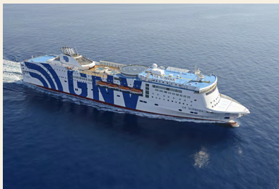
Grandi Navi Veloci